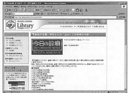
図4. 「医学書院ライブラリー」トップページ

内でございましたら特別な更新作業をすることなく、最新のコンテンツにアクセスできます。