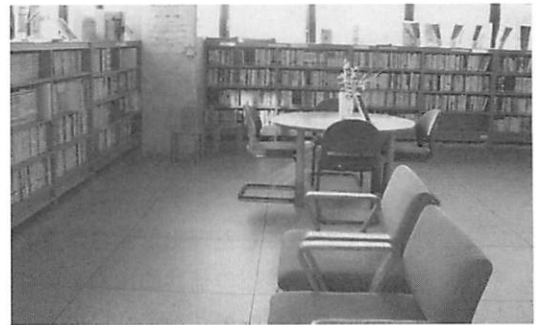
図6. 京都大学医学部附属病院「本の広場 ほっこり」

予算の都合上、大半の図書が寄贈書であるが、最近では製薬会社が発行するパンフレット類などを収集し、提供しているとのことである。