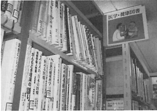
図4. 京都南病院「図書室」

用させてほしい」という要望になったという。2年間図書委員会で検討を重ねた上で、医局会の承認を得て決定し、1997年1月から医学書を患者とその家族・地域住民に公開するようになった。スタッフは専任職員の司書2名、利用時間は、平日9時から18時および土曜日の9時から17時である。