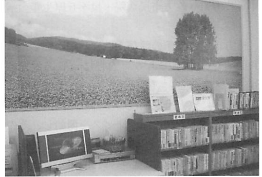
図5. 大阪厚生年金病院「患者情報室 ラヴェンダー」

一般図書の巡回サービスは、“ラヴェンダー”が開設される以前の2004年12月から行っており、現在も週2回ボランティアのスタッフ数名がブックトラックに本を積んで病棟へ出向いている。この巡回図書サービスによって、患者が医療情報を必要としていることがわかるようになったそうである。