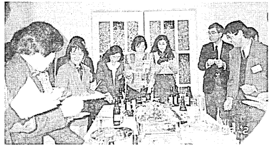
▼記念パーティーで