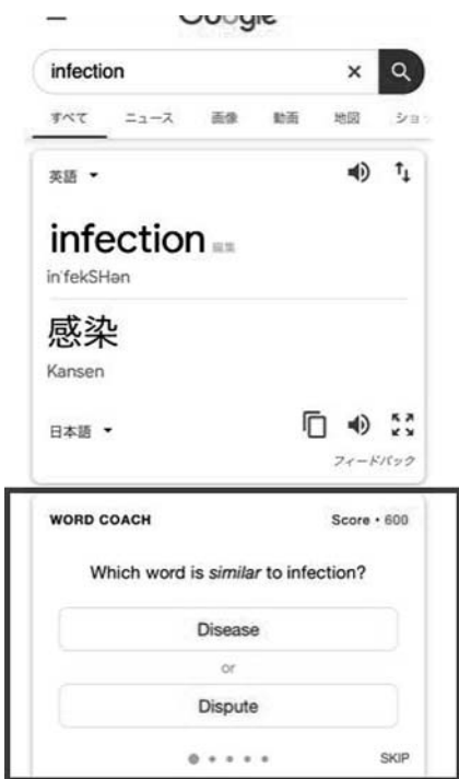
図 1 スマートフォンの Google ブラウザで単語を検索した際に起動する WORD COACH 画面